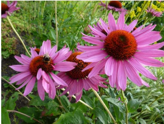
Purpur-Sonnenhut ( Echinacea purpurea )

Aus dem weiten Feld der Frauenheilkunde gibt es verschiedene Lieblingsthemen, zu denen Frau Dr. Struck seit ca. 20 Jahren Patientinnen behandelt, und auch spricht und schreibt.